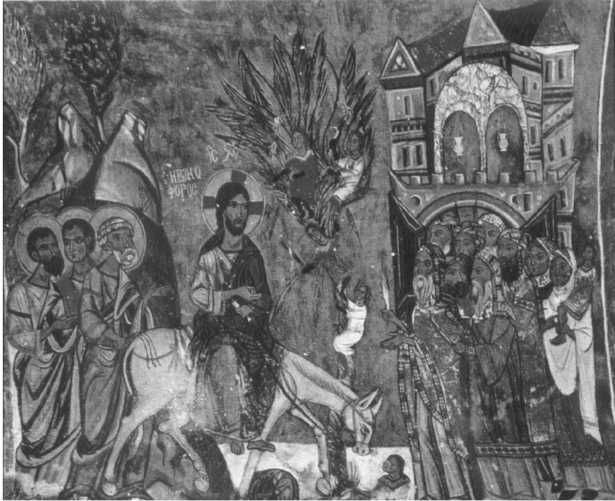
Intrarea Domnului în Ierusalim, frescă bizantină sec. 13, Cipru