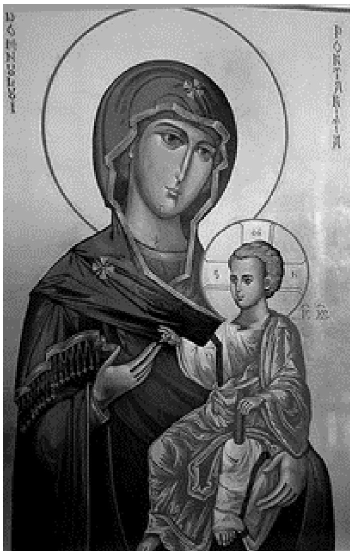
Fecioara cu Pruncul, icoană de Ionel Cristescu