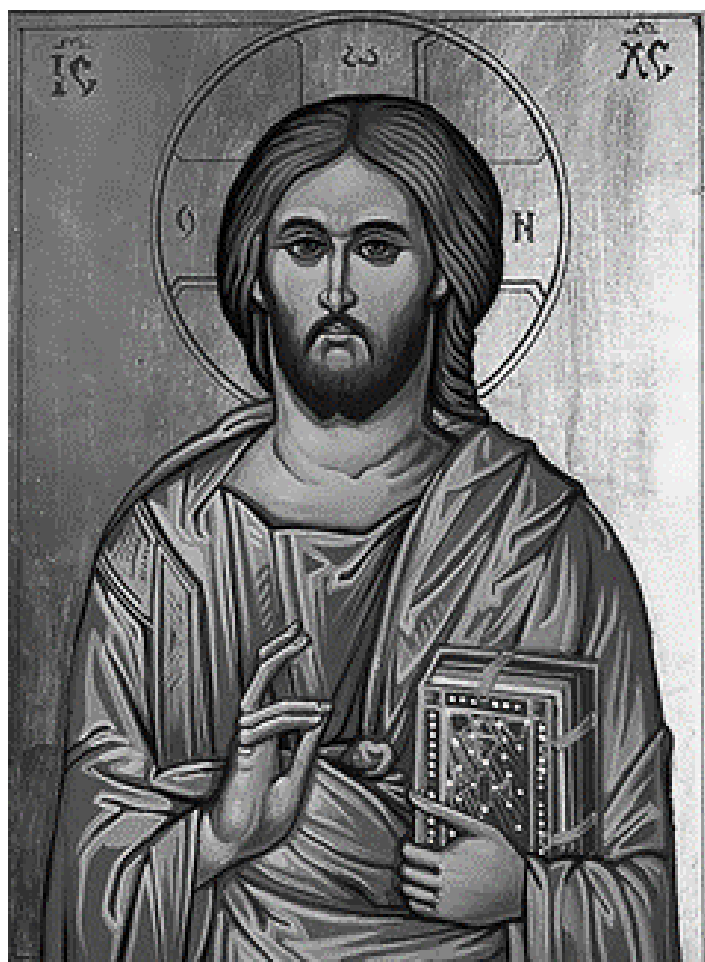
Iisus, Mântuitorul, icoană de Ionel Cristescu